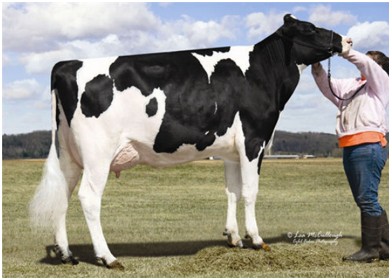
STRAUSSDALE PLANET ELLA Dam